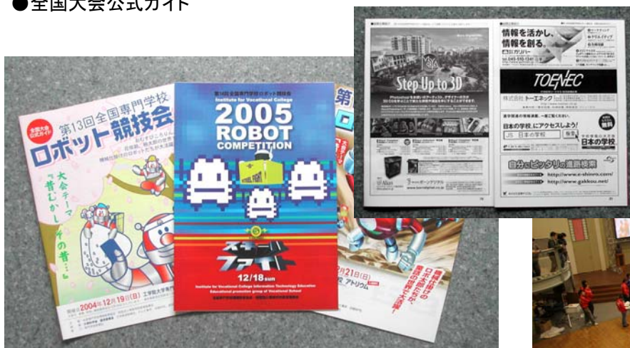
●ロボット大会風景