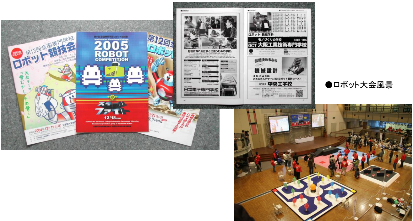
●ロボット大会風景