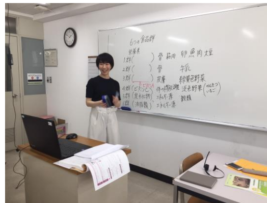
【オンライン授業の様子】