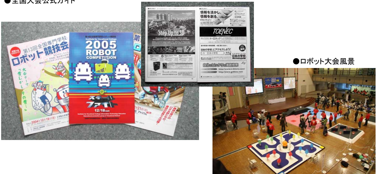
●ロボット大会風景