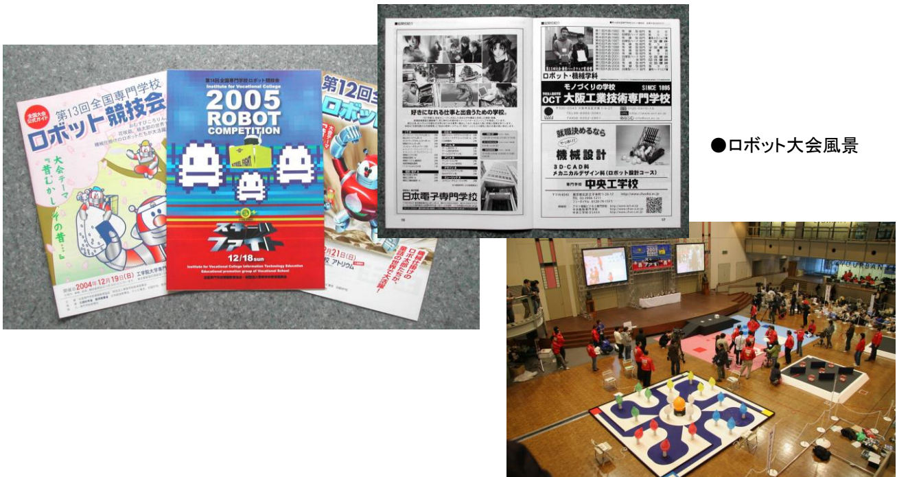
●ロボット大会風景